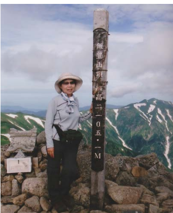
日本百名山の100山目登頂 飯豊山

◆夢を叶える 四十代も終わりの頃、職場の仲間に金時山登山に誘われた。緑の山々、空の青さ、美味しい空気、頂上から見る周囲の山々の稜線、全てが美しく清々しい気分になり、それまで学校の役員の関係から続けていたママさんバレーを辞めて山歩きをすることにしました。 山と言っても神奈川近郊の低山歩き、又はハイキング程度、世の中、中高年の登山ブームが起き始めていた時です。 NHKの趣味の百科で「中高年のための登山学」が放送されていたので本を買い登山用具を揃え、それなりの登山者になったつもり。