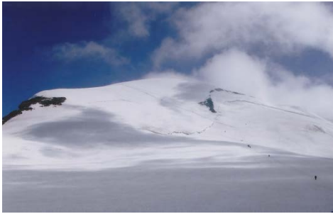
スイスのブライトホルン 4164m 登頂前

「百の頂に百の喜びあり」と書いたのは深田久弥さんだが、私が山に登って得た物は、「百の頂に百の感謝あり」です。これからも健康に注意して、季節の花を愛でながらのんびりと楽しく山歩きをしたい。