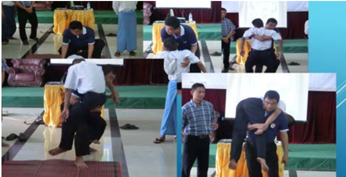
ファイアーマンズ

れの受講者がどのように考え、どのように処置をするかを重要視しているようでした。 また、三角巾の包帯法では2枚使用することなく、目や肩を1枚で行う方法や倒れている傷病者をフアイヤーマンズで搬送する方法など興味深いものがありました。 日本赤十字の処置方法はこれまででも伝えられていることから指導者はほとんど理解しているようでしたが、受講者のみなさん