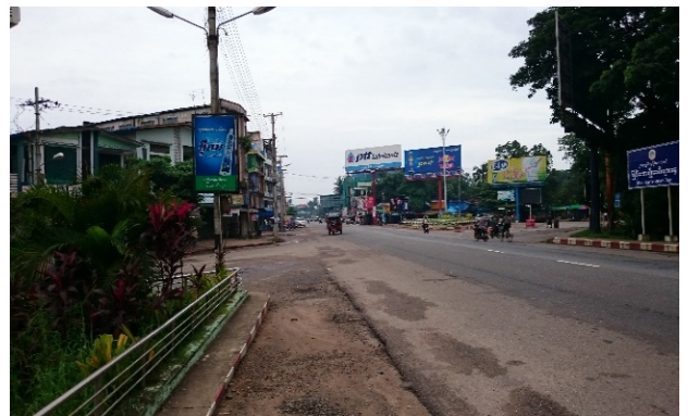
バゴーの早朝の街