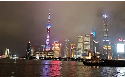
注) 東京スカイツリーではありません 上海タワーです(右)