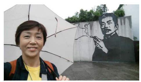
紹興酒で有名な紹興で 魯迅とツーショット！！

く響く言葉。 この言語が飛び交う中国の人はエネルギーが豊富で素朴でありのままの自分を出す民族、日本でも当たり前の事がそうでない事も多々あるが日本ではないのでそれも当然かもしれない。 何度訪れても興味は尽きない。